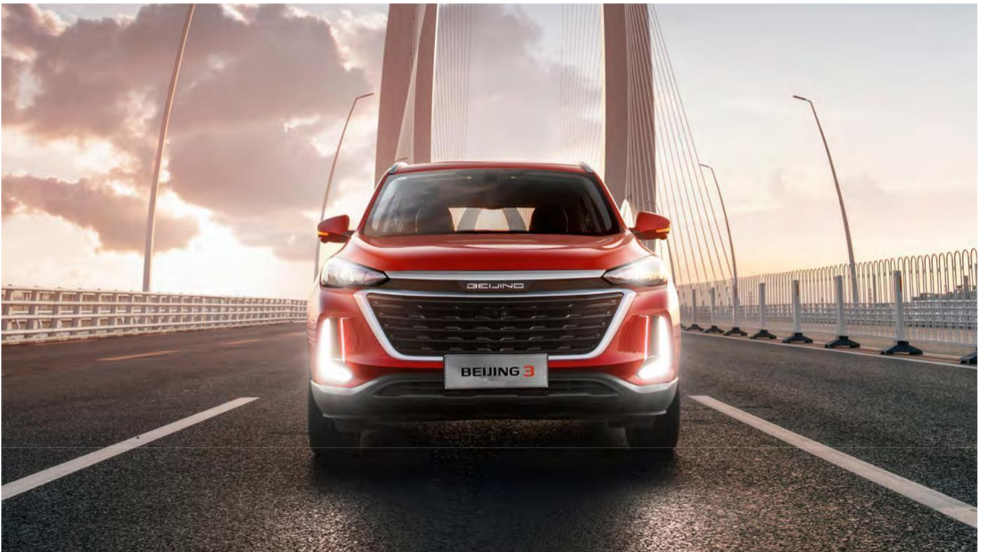
LED дневни светла