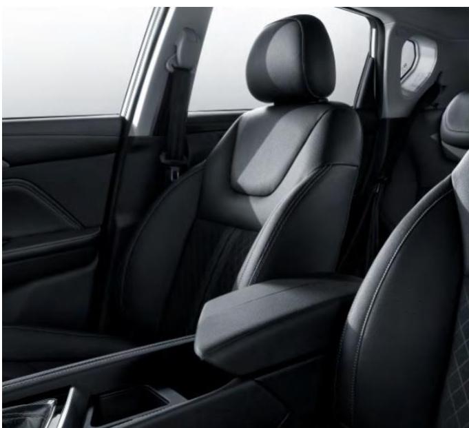
4-насочно прилагодување на совозачкото седиште