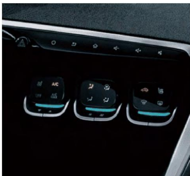
Еlegantен панел за контрола на климатизациониот систем