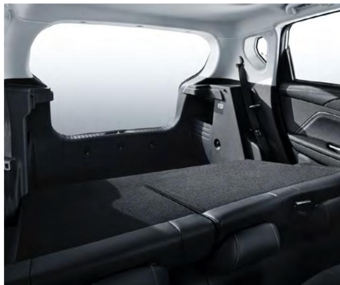
Преклопување на задните седишта 4/6