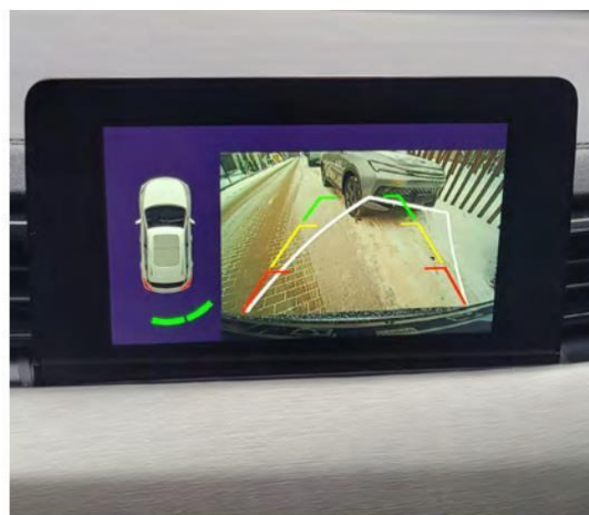
Камера за рикверц со динамични помошни линии