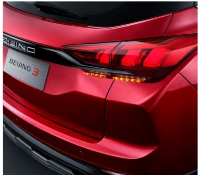
Сигнален систем за итно сопирање