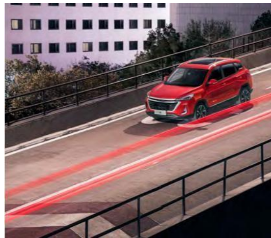
Асистент за итно сопирање EBA