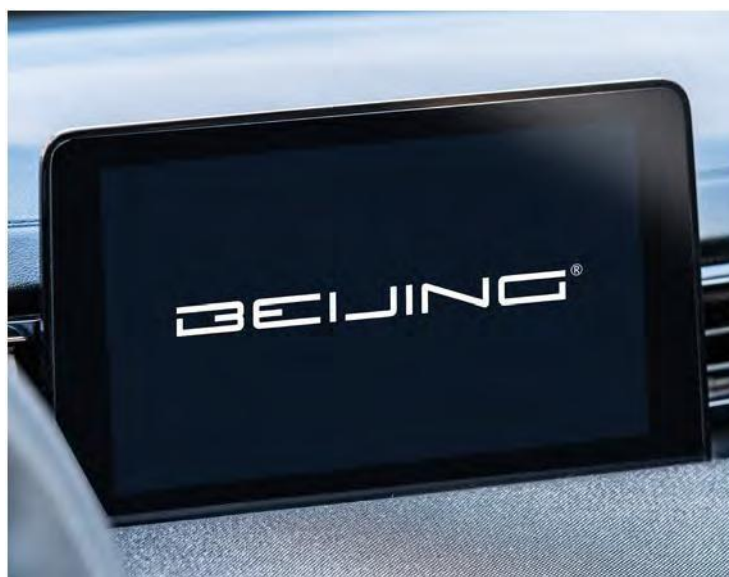
8-инчен мултимедијален екран на допир