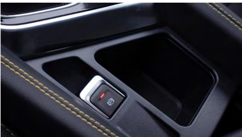
Електрична сопирачка за паркирање